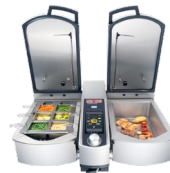
Schlau kochen VarioCookingCenter®

Das SelfCookingCenter® ist ein Combi-Dämpfer mit intelligenten Garprozessen. Die Wärmeübertragung während des Kochens erfolgt durch Dampf, Heißluft oder die Kombination aus beidem. SelfCookingControl® erkennt die Größe und Konsistenz der Speisen und definiert den optimalen Garprozess selbstständig, sodass das Wunschergebnis ohne Aufsicht immer punktgenau erreicht wird. Neben der Garintelligenz sind wesentliche Alleinstellungsmerkmale des SelfCookingCenter® die hohe Ressourceneffizienz, die einfache Bedienung, die flexible Nutzung und der minimale Reinigungs- und Pflegeaufwand. Dem Koch bleibt dadurch Zeit für das Wesentliche: Kreativität und das Wohl seiner Gäste. Mit sieben verschiedenen Gerätegrößen können wir für alle Märkte und Kundengruppen immer das richtige Produkt anbieten.