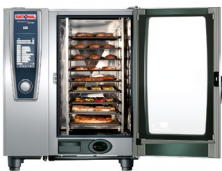
Einzigartig intelligent SelfCookingCenter®

Das SelfCookingCenter® ist ein Combi-Dämpfer mit intelligenten Garprozessen. Die Wärmeübertragung während des Kochens erfolgt durch Dampf, Heißluft oder die Kombination aus beidem. SelfCookingControl® erkennt die Größe und Konsistenz der Speisen und definiert den optimalen Garprozess selbstständig, sodass das Wunschergebnis ohne Aufsicht immer punktgenau erreicht wird. Neben der Garintelligenz sind wesentliche Alleinstellungsmerkmale des SelfCookingCenter® die hohe Ressourceneffizienz, die einfache Bedienung, die flexible Nutzung und der minimale Reinigungs- und Pflegeaufwand. Dem Koch bleibt dadurch Zeit für das Wesentliche: Kreativität und das Wohl seiner Gäste. Mit sieben verschiedenen Gerätegrößen können wir für alle Märkte und Kundengruppen immer das richtige Produkt anbieten.