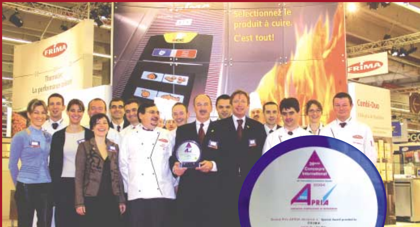
GRAND PRIX APRIA Innovationspreis 2004