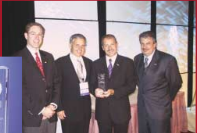
FCSI 2004 Manufacturer of the Year Award