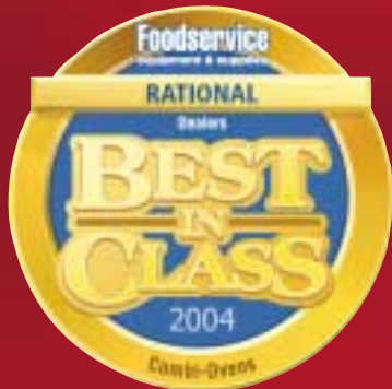
Best in Class 2004