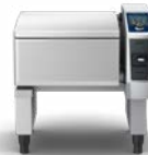
Der iVario® The Game Changer.

Die beiden Combi-Dämpfer iCombi Pro und iCombi Classic sind erfolgreich im Markt etabliert. Der iCombi Pro ist der intelligente Combi-Dämpfer mit der größten integrierten Kochexpertise auf dem Markt. Ihn zeichnen vor allem Benutzerfreundlichkeit, sichere Küchenabläufe sowie sichere Wunschergebnisse aus. Damit ist dieser Combi-Dämpfer für jeden Anwender geeignet. Der iCombi Classic hingegen ist ein manueller Combi-Dämpfer für den ausgebildeten Koch. Trotzdem steht auch er – wie der iCombi Pro – für herausragende Speisenqualität, Zeitersparnis und eine solide Investitionssicherheit bei hohen Hygienestandards. Beide Combi-Dämpfer werden am Hauptsitz in Landsberg am Lech produziert und weltweit vermarktet.