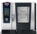
Der iHexagon® Business auf der Überholspur.

Der iVario ist ein multifunktionales Kochsystem, das es als Ein- oder Zwei-Tiegel-Geräte gibt. Die beiden Ein-Tiegel-Geräte lösen in der Produktion, z. B. in der Gemeinschaftsverpflegung, unter anderem Kipper, Kessel und Druckgargerät ab. Die beiden Zwei-Tiegel-Geräte lösen in der Produktion und im Service, z. B. im Restaurant, unter anderem Herd, Topf, Pfanne, Druckgärer und Bain-Marie ab. Dank des patentierten Heizsystems iVarioBoost ist ein iVario ca. 4-mal schneller und spart bis zu 40% an Energie im Vergleich zu herkömmlicher Küchentechnologie. So können unsere Kunden Arbeitszeit, Platz sowie Geräte sparen und trotzdem beste Speisenqualität anbieten.