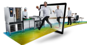
ConnectedCooking Ihre Küche kann mehr.

Der iHexagon ist der Spezialist für höchste Speisenqualität in kürzester Zeit. Dazu stimmt er Heißluft, Dampf und Mikrowelle intelligent aufeinander ab und schafft es als Einziger im Markt, die drei Energieformen über alle Einschübe im Garraum gleichmäßig zu verteilen. Dank der lückenlosen Überwachung und permanenten Unterstützung durch die eingebaute Kochintelligenz ist kein Eingreifen von außen notwendig. Diese neue Produktkategorie richtet sich an alle, die Qualität und Schnelligkeit in ihrer DNA haben.