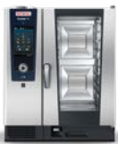
Der iCombi® Der Wow-Effekt.

Die gesamte Produktpalette muss sich an einem Ziel messen lassen: am Kundennutzen.